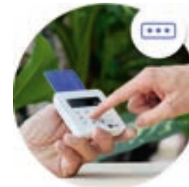
CHIP & PIN