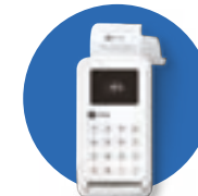
SumUp 3G+ impresora